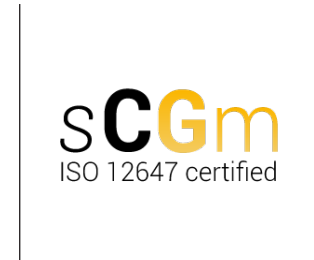
Logo certificaat SCGM ISO 12647 (Engelstalige versie)