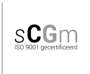
Logo certificaat SCGM ISO 9001 (zwarte versie)