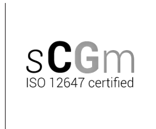
Logo certificaat SCGM ISO 12647 (Engelstalige, zwarte versie)