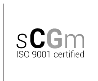
Logo certificaat SCGM ISO 9001 (Engelstalige, zwarte versie)