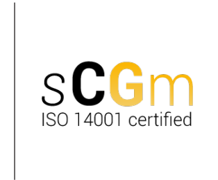
Logo certificaat SCGM ISO 14001 (Engelstalige versie)