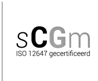
Logo certificaat SCGM ISO 12647 (zwarte versie)