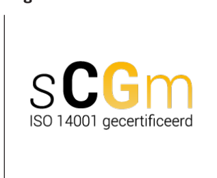
Logo certificaat SCGM ISO 14001