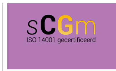
logo gebruik op een contrasterende achtergrond

Op de volgende pagina staan een paar voorbeelden van niet-correct en correct logogebruik.