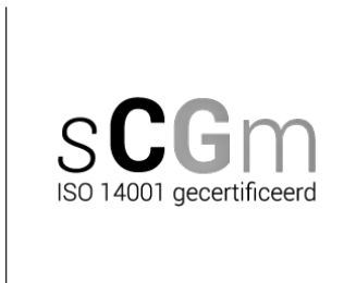
Logo certificaat SCGM ISO 14001 (zwarte versie)