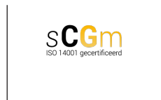
minimale hoogte: 10 mm