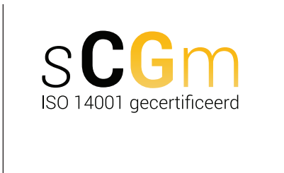
logo in eps-formaat

Bij full color drukwerk wordt de PMS-kleur als volgt opgebouwd: